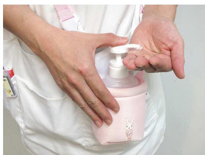
【個人携帯している手指消毒剤】

当院では院内感染対策委員会を設置し、感染しないこと・感染したときに周りに広めないこととして感染の経路別に対策を取る、スタンダードプリコーション（感染の有無に関わらず全ての患者さんを対象に感染の可能性があるとみなす標準予防策）を行う感染予防策や手洗い（手指消毒）・ワクチン接種の把握に力を入れています。